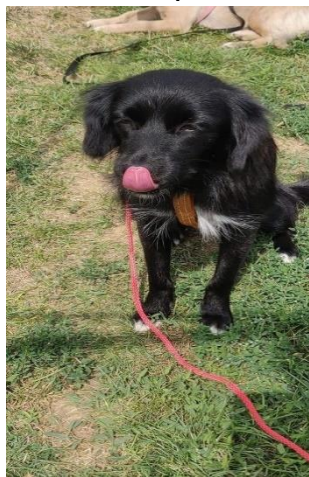
Un chien peut indiquer son inconfort lors d'une interaction en baillant, en détournant le regard ou en tournant la tête.

Il faudra également observer les signaux d'apaisement qui peuvent indiquer sa volonté d'augmenter la distance physique avec vous. Si vous respectez sa volonté, vous gagnerez sa confiance. Par exemple, le chien se lèche le nez (à ne pas confondre avec le léchage de babines quand il y a de la nourriture), il baille alors qu'il n'est pas fatigué, il fuit votre regard en tournant la tête, il se lève pour se tourner, il cherche à s'éloigner.